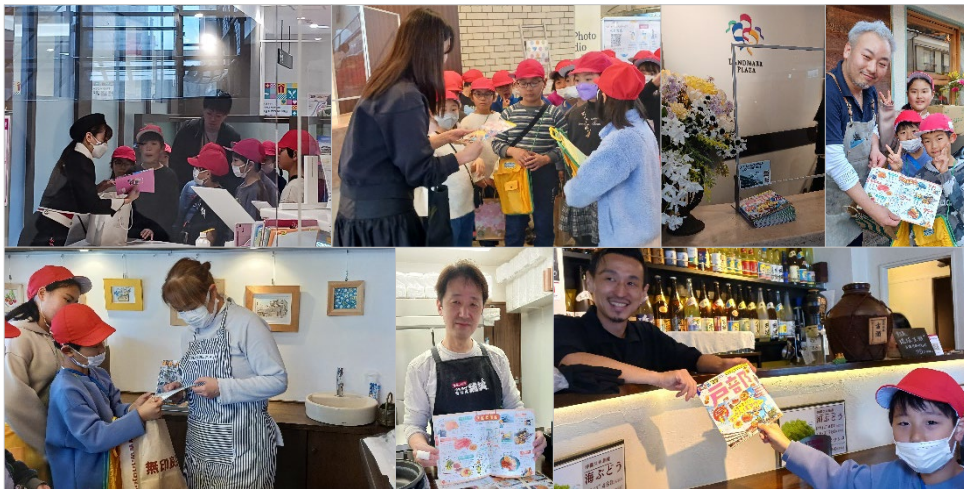
<2024年3月、完成した冊子を取材施設・店舗に成果報告した際の様子>

10月以降は実際に学校周辺の施設・店舗に児童が出向き、取材を実施。年明けに取材成果（取材先の各種データや紹介テキスト類および撮影画像）がまとまり、昭文社にて誌面制作に着手。デザイン、誌面の組版、地図制作、校正を経て、3月上旬に完成、3月11日（月）には、学校周辺の施設や店舗の方に成果報告として特別編集版冊子をお渡ししました。