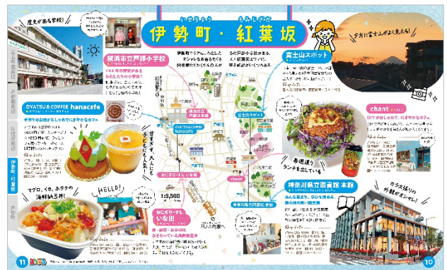
<代表誌面2「伊勢町・紅葉坂」>