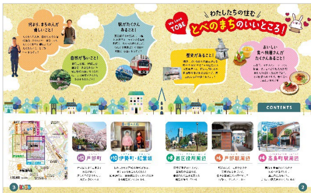
<代表誌面1「とべのまちのいいところ！」>