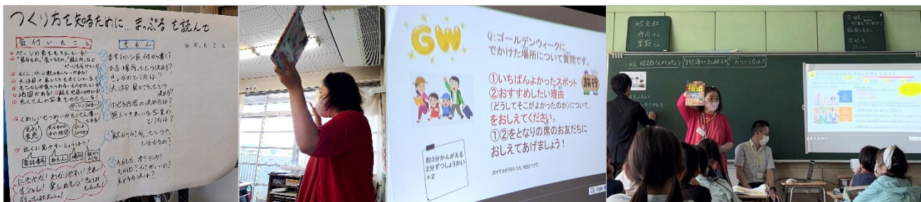
<2023年6月の第1回特別授業の様子>

まず2023年6月に「ガイドブックとはどういうものか」「ガイドブックを作る人々の仕事の内幕」「実際におでかけプランを作成してみよう」という観点からの特別授業を実施。それまで2カ月近く、実際のガイドブックを見ながら探求を進めてきた児童のみなさんは理解が非常に早く、おでかけプランでどんなスポットを紹介すればよいか、いくつかのグループ単位で相談しながらアイデアを書き出すなど、 座学&ワークショップ に取り組みました。