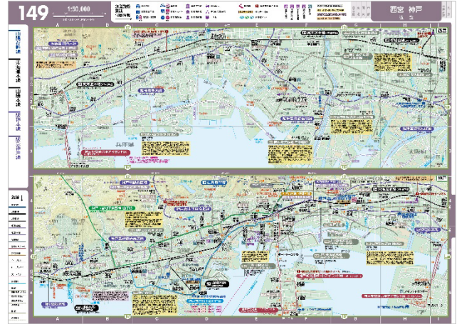
<今回の改訂で増強された詳細図 左：「砂川 岩見沢 夕張」、右：「西宮 神戸」>