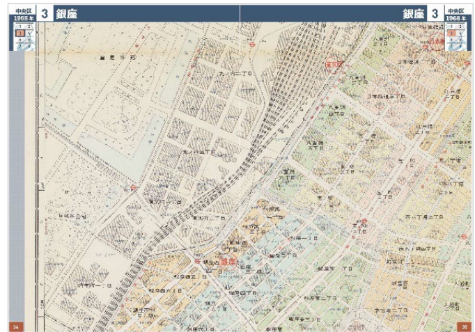
<中央区・銀座（1968年版）>