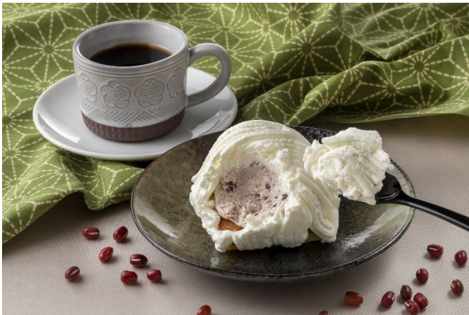
<「丹波大納言小豆のみるく金時モンブラン」商品イメージ>