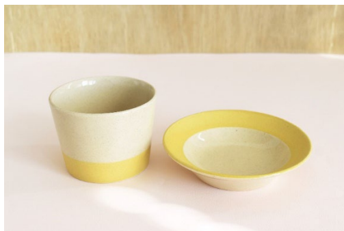
<ことりっぽオリジナルグッズ（ちょこ&ござら）>

抽選で10名様（各5名様ずつ）に『ことりっぽオリジナルグッズ（ちょこ&ござら）』をプレゼントいたします。