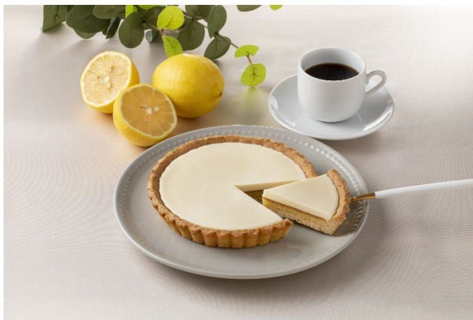
<「瀬戸内レモンの生レモンケーキ」商品イメージ>

◆発売地区：北海道・東北・関東甲信越・東海・北陸・近畿・中国・四国（※一部除外あり）