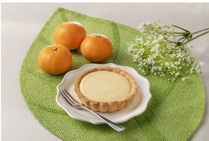
<「三ヶ日青島みかんのタルト」商品イメージ>

◆発売地区：北海道・東北・関東甲信越・東海・北陸・近畿・中国・四国（※一部除外あり）