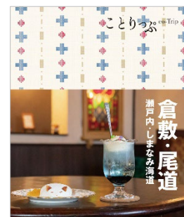
<ことりっぶ倉敷・尾道の表紙>

パッケージにはことりっぶの表紙柄をあしらひ、地域の魅力的な食材を使ったスイーツを味わいながら、旅気分を楽しめます。