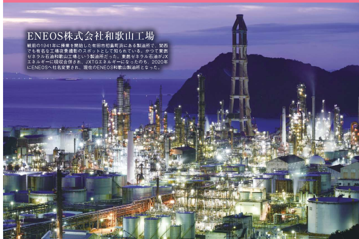
ENEOS株式会社和歌山工場

戦前の1941年に操業を開始した和歌山初島町にある製油所。夏でも有名な工場夜景撮影のスポットとして知られている。かつて東宮セラル石油和歌山工場という製油所だった。東宮セラル石油の次エネオスへ譲渡合併され、ATCエネルギーとなったものの、2020年にENEOSへ社名変更され、現在のENEOS和歌山製油所となった。