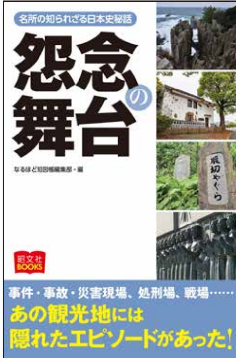
B6変形判・208ページ 定価：990円（本体900円）