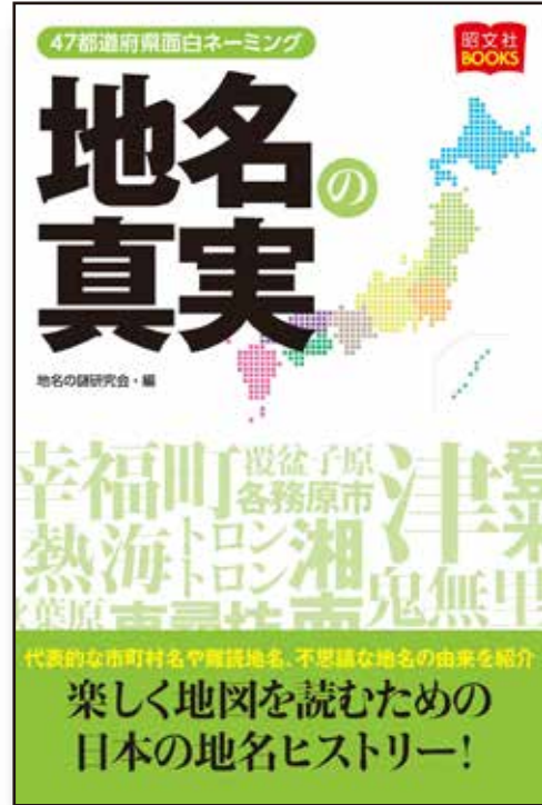
B6変形判・256ページ 定価：1210円（本体1100円）