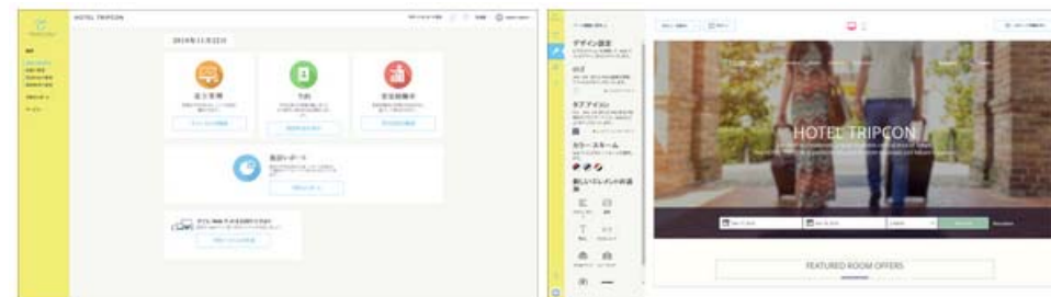
<「トリプコンビズ」管理画面イメージ>

国内外からの集客を一元管理で効率化することで、インバウンド含めた販売促進に貢献して参ります。