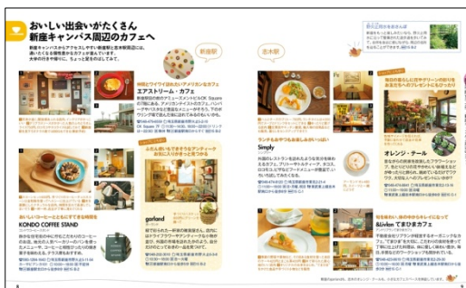
＜新座キャンパス周辺のカフェ＞