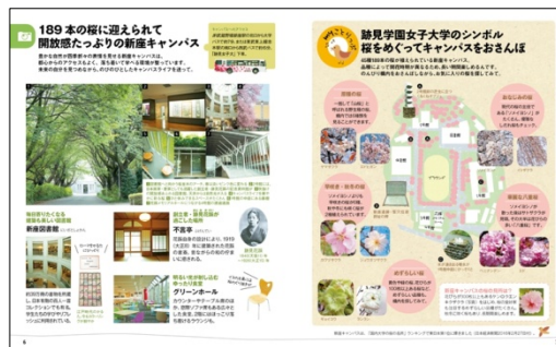
＜新座キャンパス紹介ページ＞