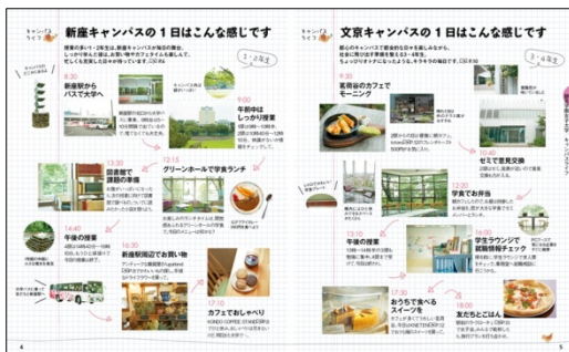
＜「各キャンパスの1日」紹介ページ＞