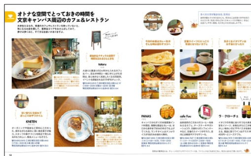
＜文京キャンパス周辺のカフェ&レストラン＞